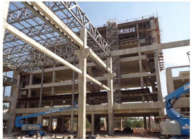
Em execução a laje superior do Bloco B e estruturas metálicas do Bloco A.