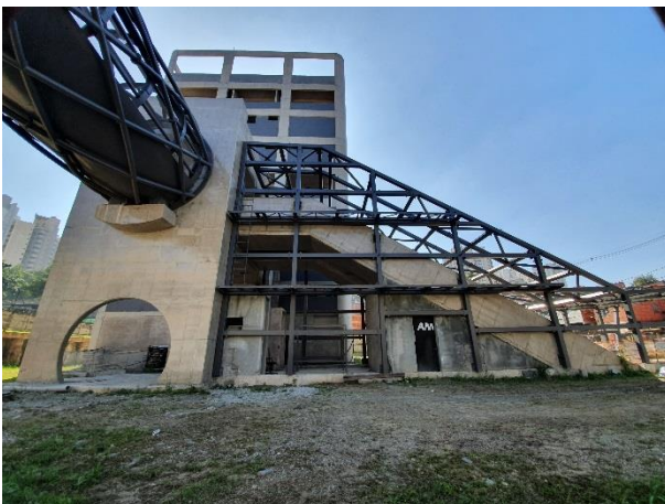
Acesso A: Montagem da estrutura metálica em andamento.