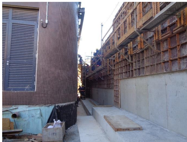
Obra Civil – execução do muro de contenção do acesso Sul.