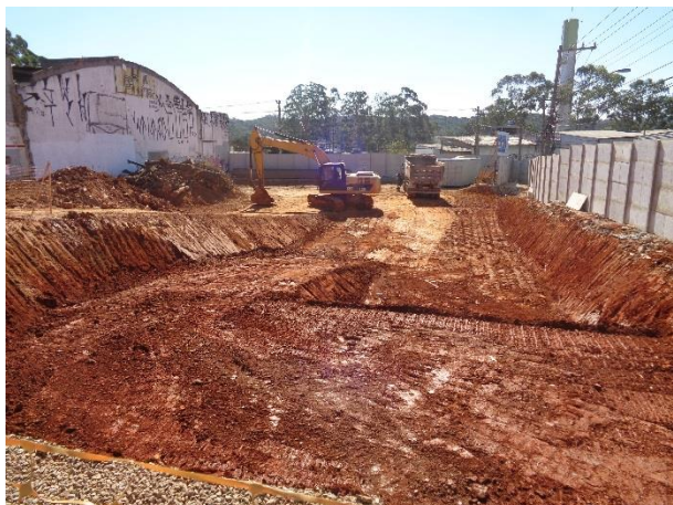
Obra Civil – escavação para execução da fundação do acesso Norte.