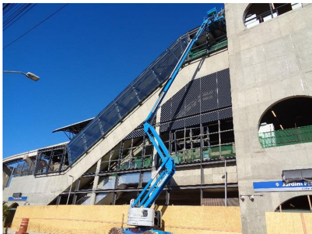
Obra Civil - instalação dos vidros e fechamentos no Acesso Norte.