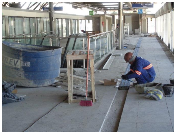
Obra civil – instalação do piso de granito e tátil da plataforma sul.