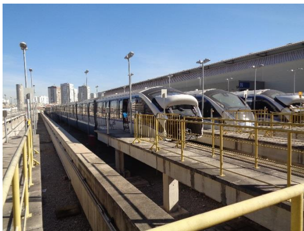
Trens nas vias de estacionamento do Pátio Oratório