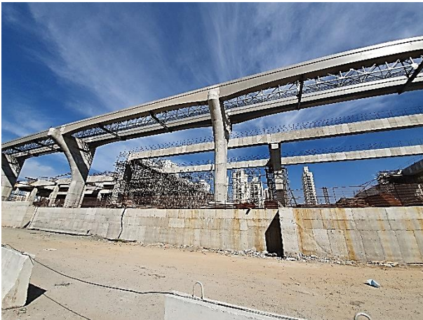
Vista das vias do monotrilho.