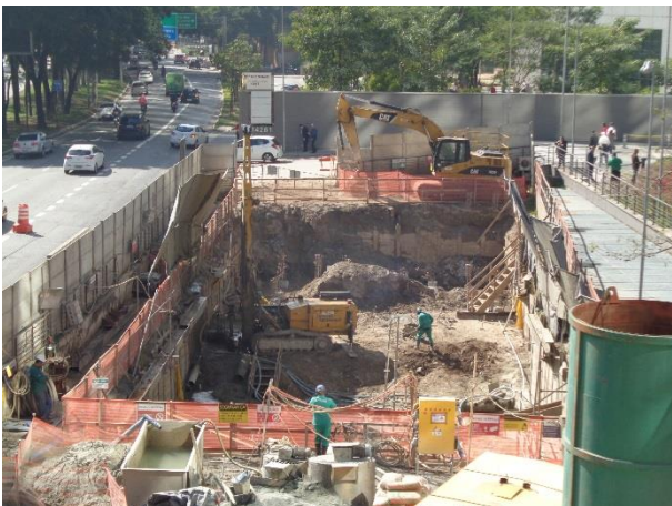
Acesso - Escavação do porão de cabos em andamento.