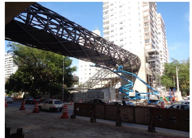
Acesso 2: Montagem da estrutura metálica em andamento.