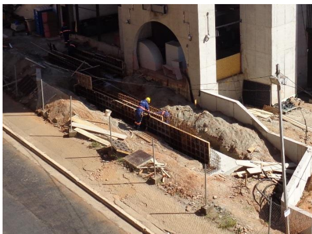
Obra Civil – execução do muro de contenção do Acesso Norte.