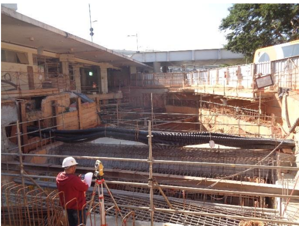
Acesso ao Aeroporto - Execução de laje do acesso.