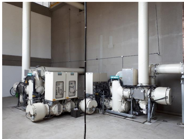
Detalhe da Subestação Isolada a Gás (GIS).