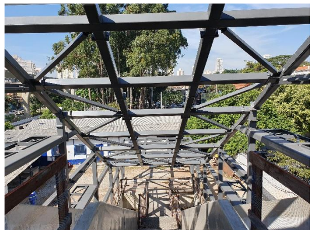
Acesso B: estrutura metálica