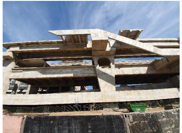
Corpo da Estação